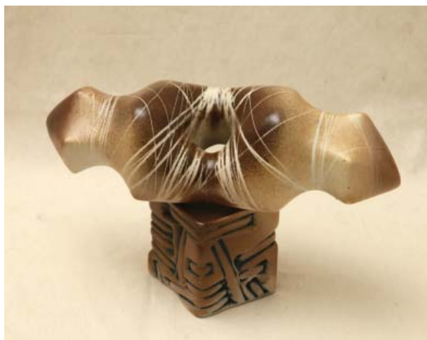
Elena Mogorean. Totem , anii 1990, porțelan